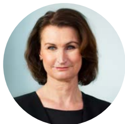
Viveca Bergstedt Sten

Tidigare uppdrag: Ordf. för Pensionsmyndigheten 2016-2018. Partiledare (KD) 2004-15. Socialminister 2006-14. Riksdagsledamot 1991-2015.