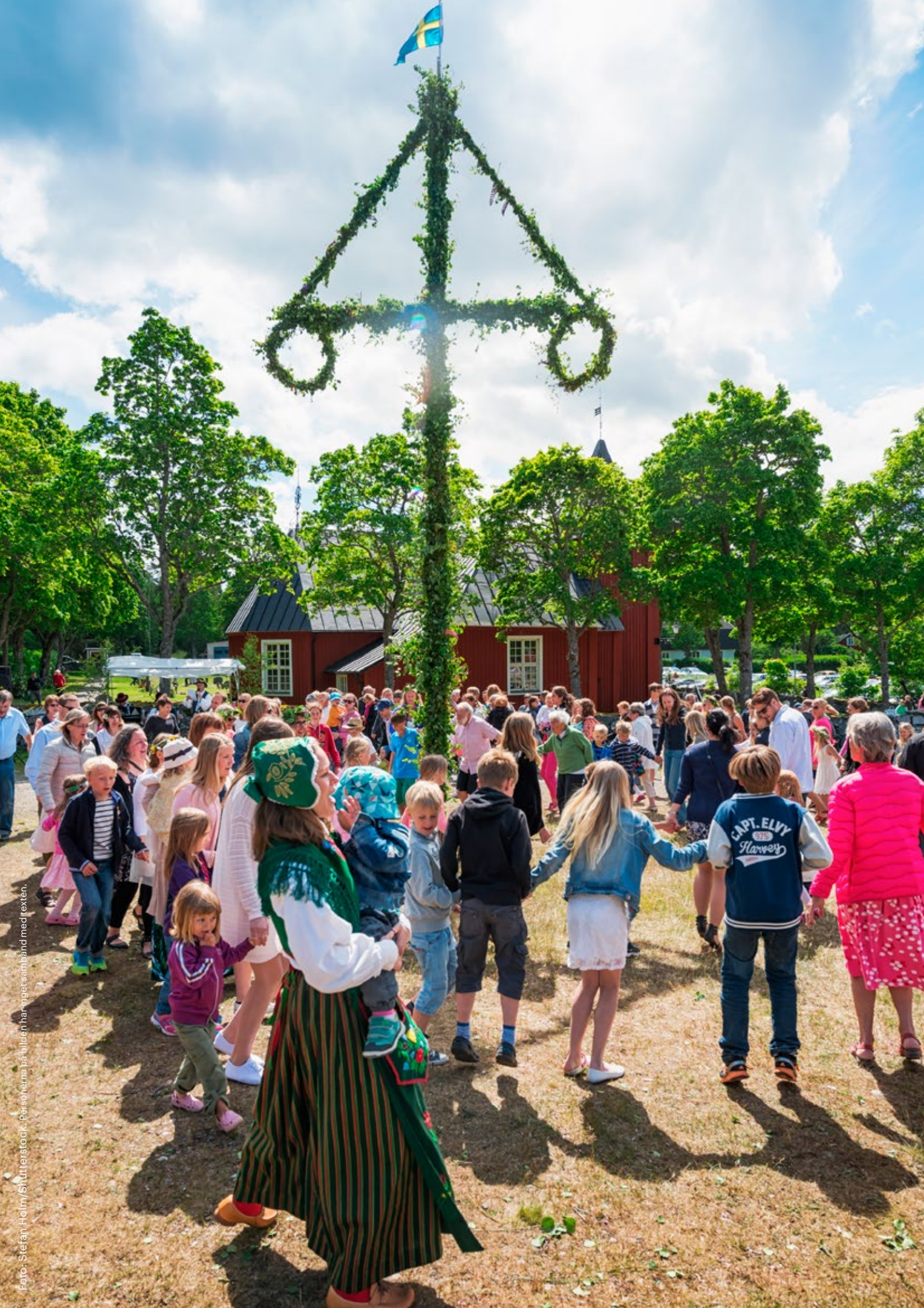
Personerna på bilden har inget samband med texten.