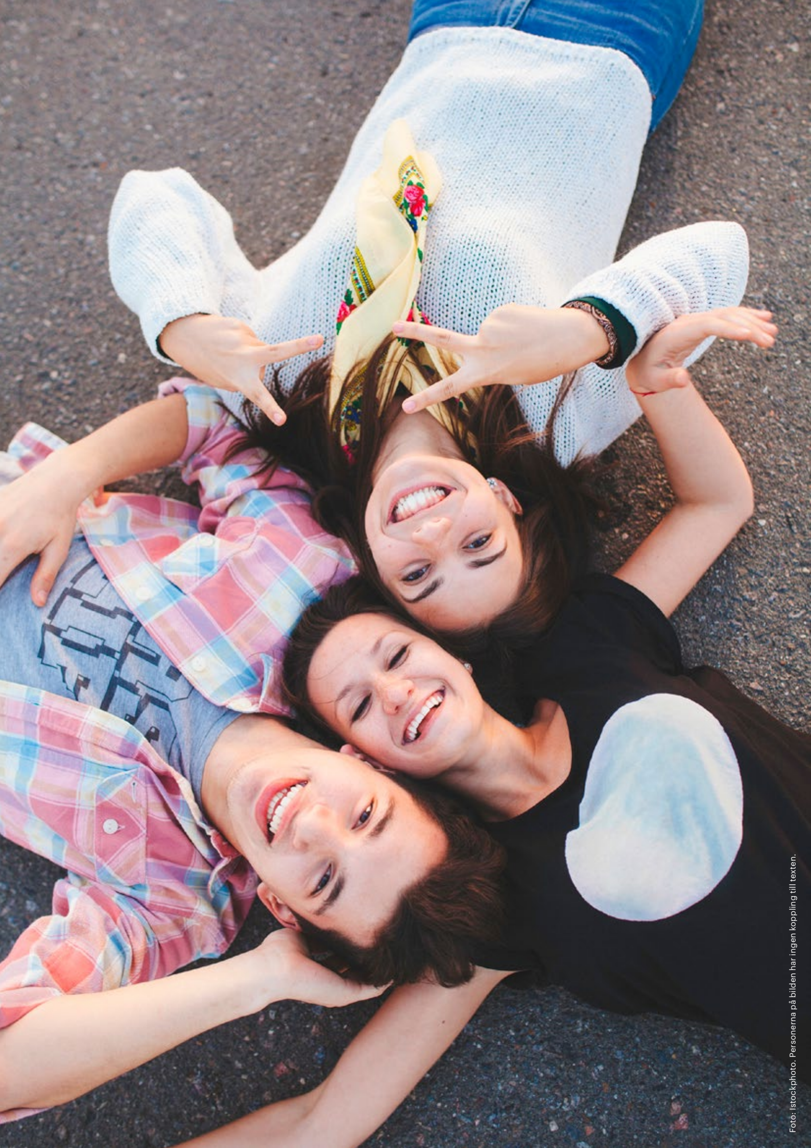
Foto: istockphoto. Personerna på bilden har ingen koppling till texten.