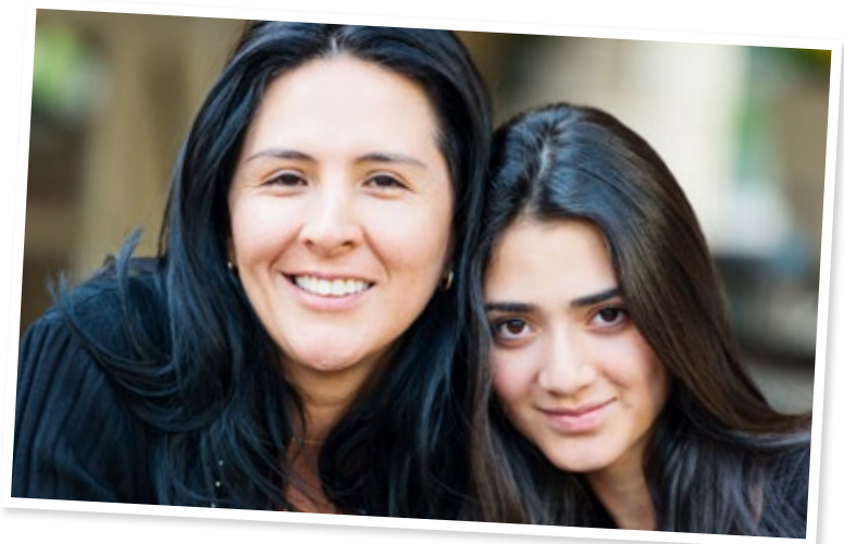
Foto: Istockphoto. Personerna på bilden är inte de som nämns i texten.

Berusad Person som druckit mycket alkohol. Full.