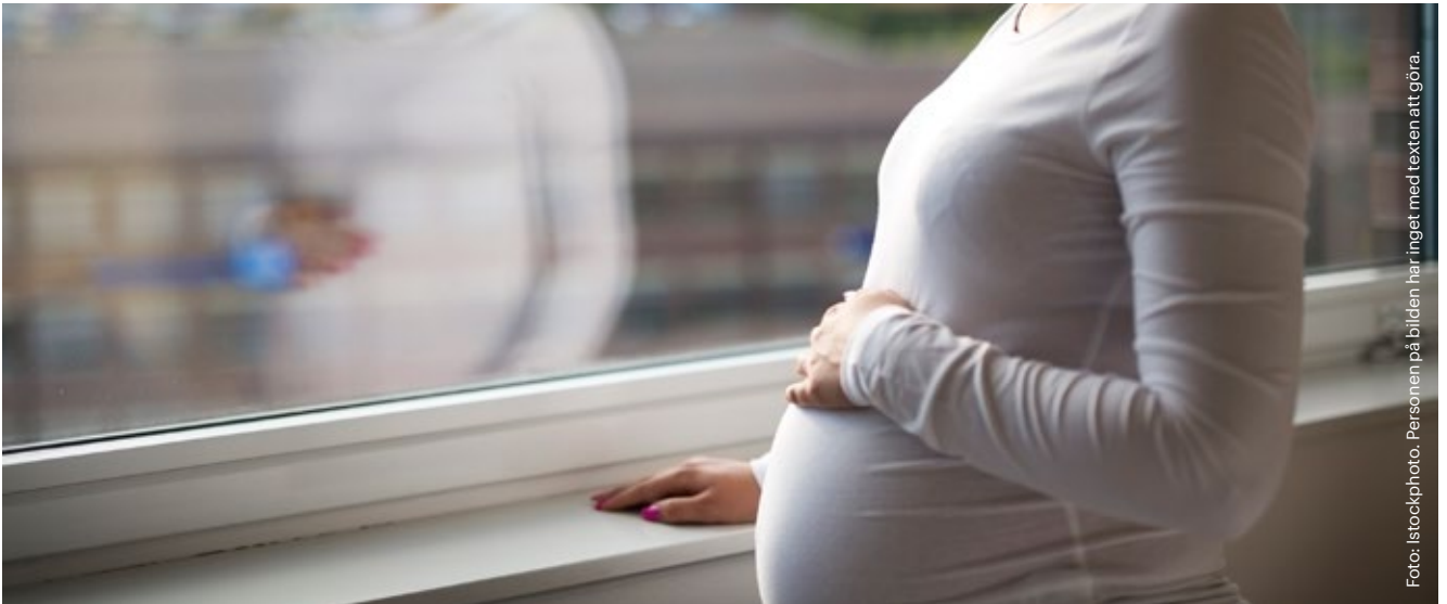
Personen på bilden har inget med texten att göra.