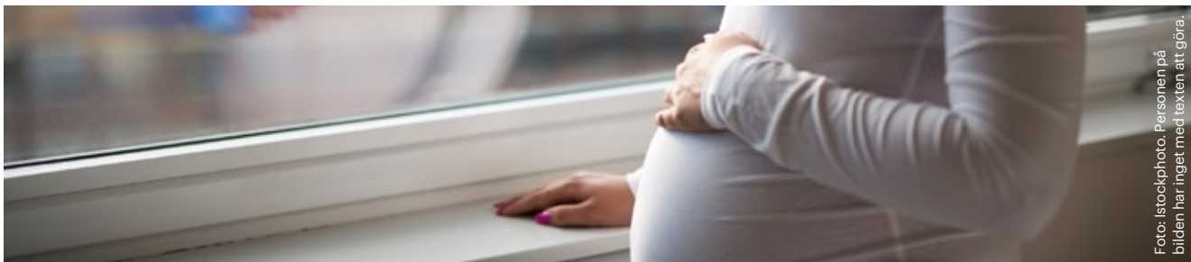
Foto: Istockphoto. Personen på bilden har inget med texten att göra.