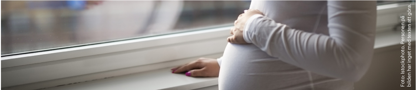
Foto: iStockphoto. Personen på bilden har inget med texten att göra.